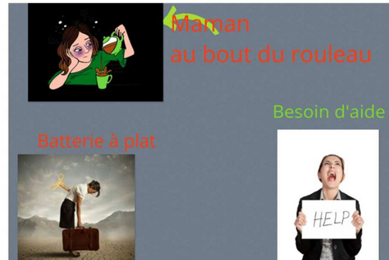
Représentation de l'épuisement par une mère aidante

* Maslach Burnout Inventory ; MBI (Maslach & Jackson, 1986 ; Dion & Tessier, 1994)